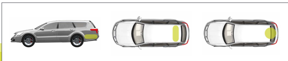
Esempi di installazione del serbatoio GPL