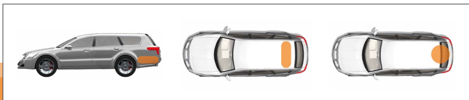
Esempi di installazione del serbatoio GPL